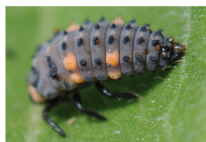
Larve gris clair, 4 taches orange